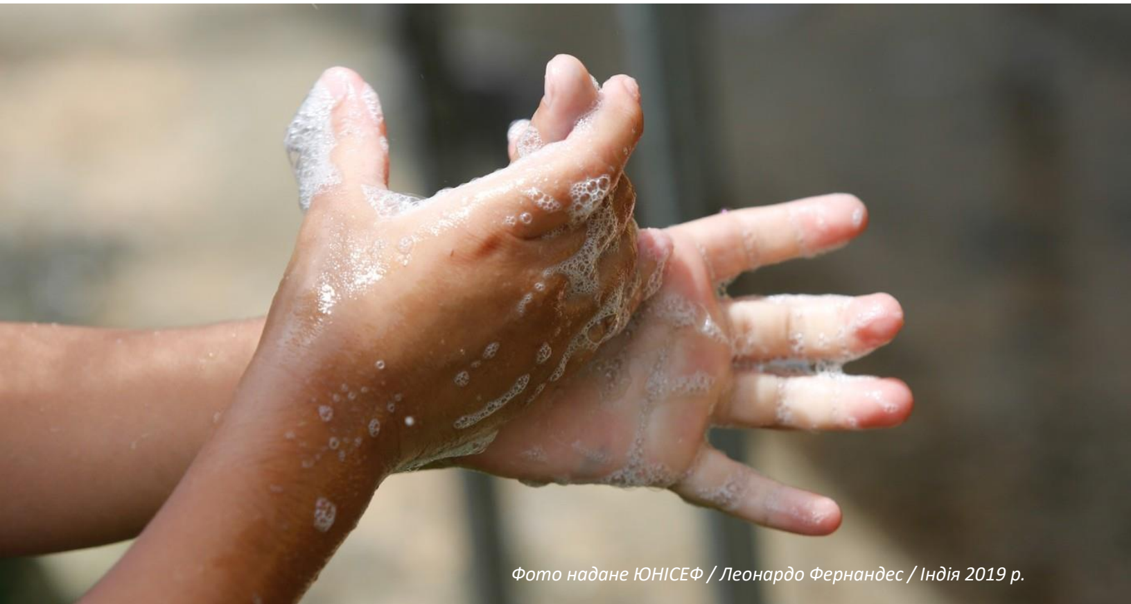
Фото надане ЮНІСЕФ / Леонардо Фернандес / Індія 2019 р.